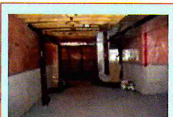
Ремонт подвальных помещений