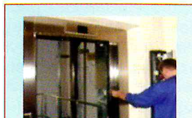
Ремонт или замена лифтового оборудования